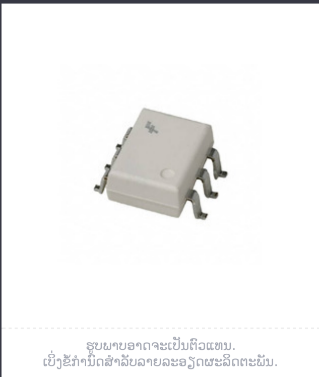
ຮູບພາບອາດຈະເປັນຕົວແທນ. ເບິ່ງຂໍ້ກຳນົດສໍາລັບລາຍລະອຽດຜະລິດຕະພັນ.